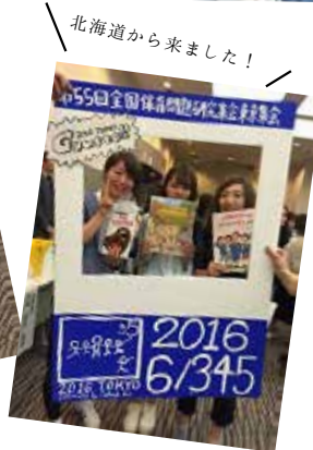
北海道から来ました!