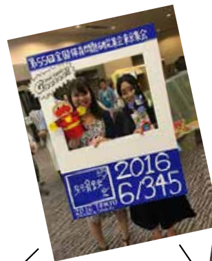
大阪から来ました! ペット、カップを買いました