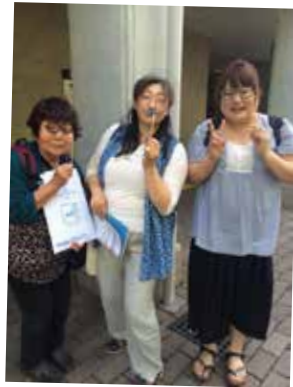
夜のしゃべり場にも来てね