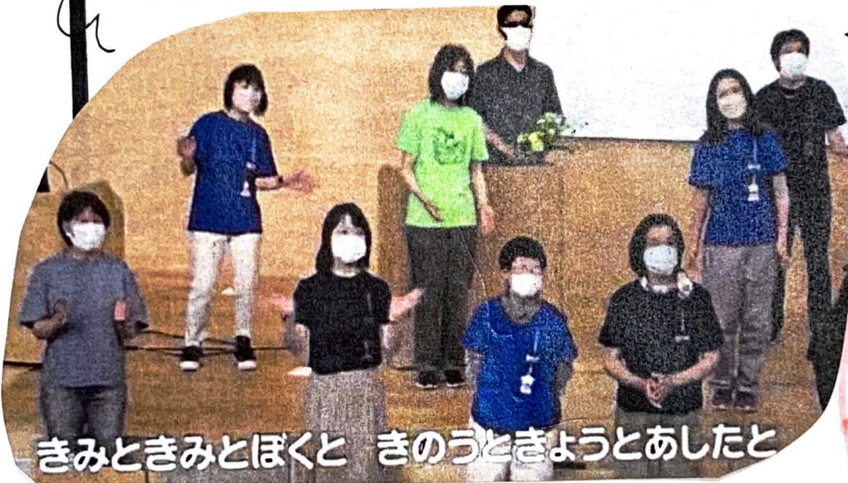
きみときみとぼくと きのうときようとあしたと