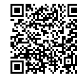
〈博多駅→なみきスクエア〉

QRコードは“博多駅→なみきスクエア”、“博多駅→九州産業大学”への道のりを示した動画です。ぜひ、ごらんになってくださいね。