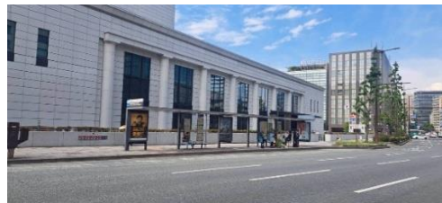
〈天神日銀前(19Aのりば)〉