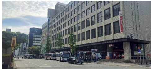
〈天神中央郵便局前(18Aのりば)〉